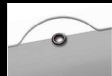
Kalender Aufhängung mit Lasche ...

Die stabile, hochwertige Tagesmarkierung ist komplett montiert – ohne Mehrpreis. Die transparente Trägerfolie für die Tagesmarkierung ist hierbei leicht eingefärbt, harmonisch abgestimmt zur Fondfarbe der Vor- und Nachfolgemonate Ihres Werbekalenders. (Bei durchgängig weißem Kalendarium ist der weekmaster glasklar)