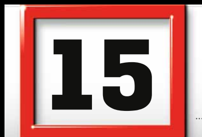
Datumsweiser und Ziffern in Originalgröße.

Das Zeichen für verantwortungsvolle Waldwirtschaft