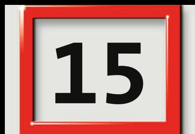
Datumsweiser und Ziffern in Originalgröße.