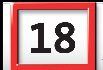
Datumsweiser und Ziffern in Originalgröße.

Die stabile, hochwertige Tagesmarkierung ist komplett montiert – ohne Mehrpreis. Die transparente Trägerfolie für die Tagesmarkierung ist hierbei leicht eingefärbt, harmonisch abgestimmt zur Fondfarbe der Vor- und Nachfolgemonate Ihres Werbekalenders. (Bei durchgängig weißem Kalendarium ist der weekmaster glasklar)