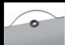
Kalender Aufhängung mit Lasche ...

Die stabile, hochwertige Tagesmarkierung ist komplett montiert – ohne Mehrpreis. Die transparente Trägerfolie für die Tagesmarkierung ist hierbei leicht eingefärbt, harmonisch abgestimmt zur Fondfarbe der Vor- und Nachfolgemonate Ihres Werbekalenders.