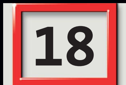
Datumsweiser und Ziffern in Originalgröße.