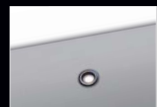
Kalender Aufhängung ohne Lasche (gerader Titel)