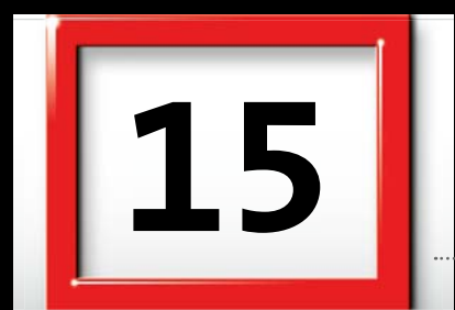
Datumsweiser und Ziffern in Originalgröße.

Die stabile, hochwertige Tagesmarkierung ist komplett montiert – ohne Mehrpreis. Die transparente Trägerfolie für die Tagesmarkierung ist hierbei leicht eingefärbt, harmonisch abgestimmt zur Fondfarbe der Vor- und Nachfolgemonate Ihres Werbekalenders. (Bei durchgängig weißem Kalendarium ist der weekmaster glasklar)