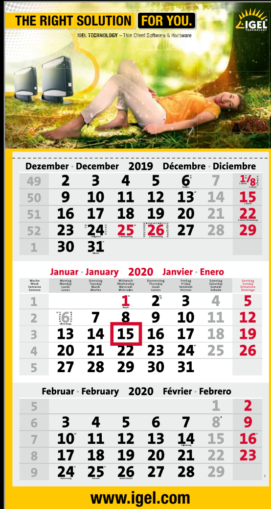
BEISPIEL KALENDARIUM D/4-sprachig – Fondfarbe Grau