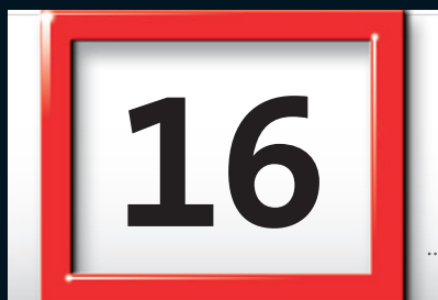
Datumsweiser und Ziffern in Originalgröße.

Die stabile, hochwertige Tagesmarkierung ist komplett montiert – ohne Mehrpreis. Die transparente Trägerfolie für die Tagesmarkierung ist hierbei leicht eingefärbt, harmonisch abgestimmt zur Fondfarbe der Vor- und Nachfolgemonate Ihres Werbekalenders. (Bei durchgängig weißem Kalendarium ist der weekmaster glasklar)