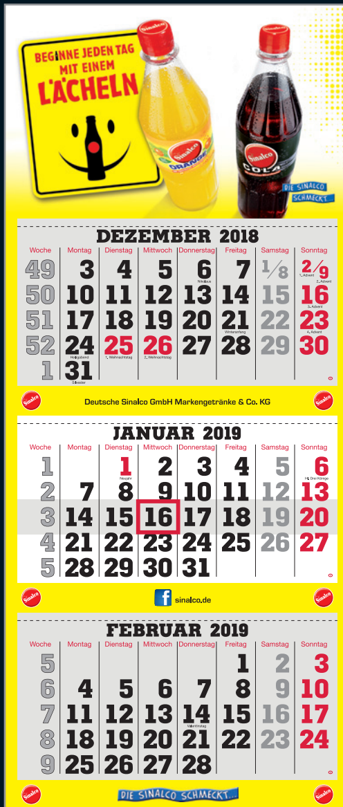
BEISPIEL KALENDARIUM Deutsch – Fondfarbe Grau