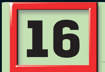
Datumsweiser und Ziffern in Originalgröße.