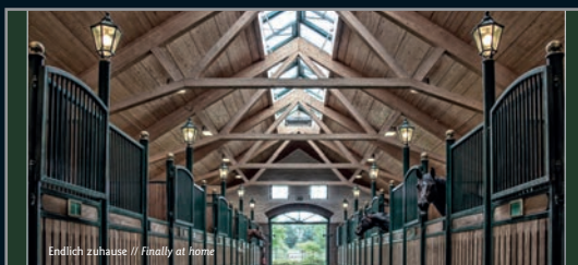
Endlich zuhause // Finally at home