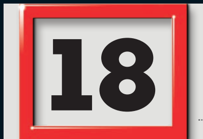
Datumsweiser und Ziffern in Originalgröße.