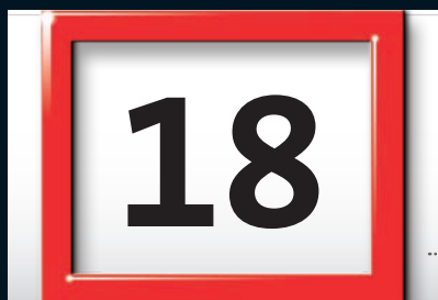
Datumsweiser und Ziffern in Originalgröße.

Die stabile, hochwertige Tagesmarkierung ist komplett montiert – ohne Mehrpreis. Die transparente Trägerfolie für die Tagesmarkierung ist hierbei leicht eingefärbt, harmonisch abgestimmt zur Fondfarbe der Vor- und Nachfolgemonate Ihres Werbekalenders. (Bei durchgängig weißem Kalendarium ist der weekmaster glasklar)